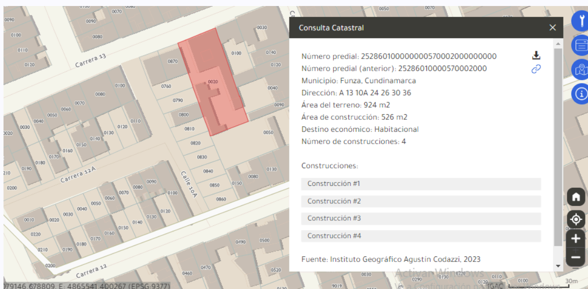
Ilustración 3 Consulta Catastral

El establecimiento comercial "Tienda de pijamas Lupe" se encuentra identificado con cédula catastral 252860100000000570002000000000, de conformidad con la consulta realizada en el geoportal del Instituto Geográfico Agustín Codazzi -IGAC.