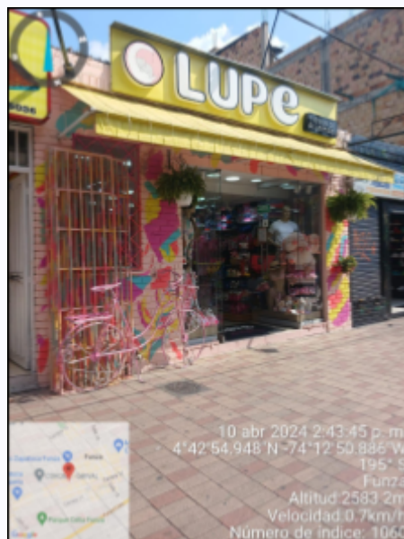
Ilustración 2. Ubicación de la queja

El establecimiento comercial "Tienda de pijamas Lupe" se encuentra identificado con cédula catastral 252860100000000570002000000000, de conformidad con la consulta realizada en el geoportal del Instituto Geográfico Agustín Codazzi -IGAC.