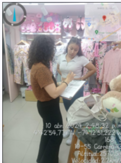
Ilustración 5. Atención a Queja

Con base en lo anterior se realizaron las siguientes recomendaciones: